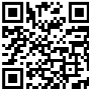
応募フォーム QR コード

※第2回目の申込人数が10名以下だった場合は、内容を変更することもあります。その場合は、メールまたは電話にてご連絡致します。